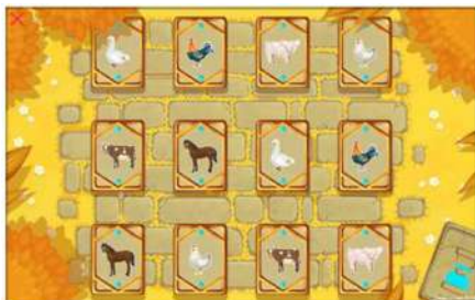
Таблица игр острова «Амазоника»