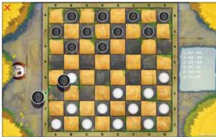
Таблица игр острова «Амазоника»