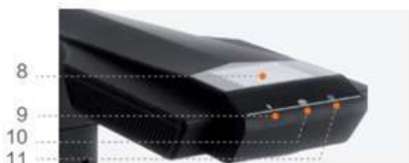
Верхняя часть (ЖК-дисплей)