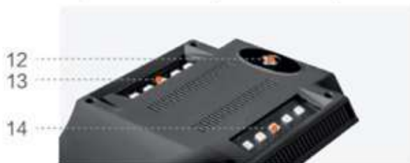
Верхняя часть (подсветка)