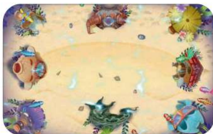
Таблица игр «Звукеан»